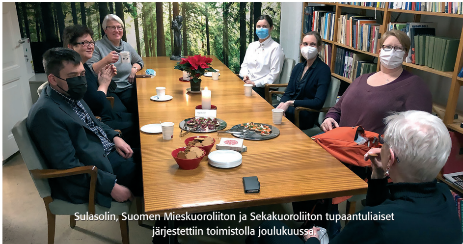
Sulasolin, Suomen Mieskuoroliiton ja Sekakuoroliiton tupaantuliaiset järjestettiin toimistolla joulukuussa.