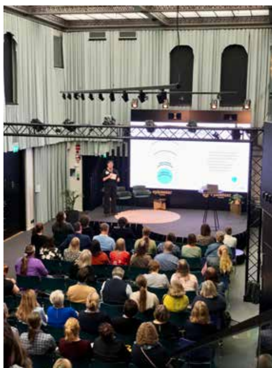
Sivis-päivä 4.10.2023.