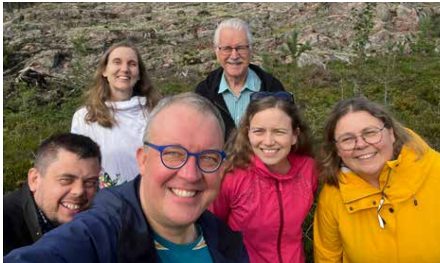
Sulasolin liittohallitus syyskuussa.

Liittokokousten välillä päätäntävaltaa käyttää liittohallitus. Liittohallituksessa oli toimintavuonna puheenjohtaja ja neljä jäsentä. Lisäksi Sulasolin taiteellisella johtajalla on läsnäolo- ja puheoikeus liittohallituksen kokouksissa. Liittohallituksen sihteerinä toimii liiton toiminnanjohtaja. Liittohallitus kokoontui vuoden 2023 aikana yhteensä 11 kertaa.