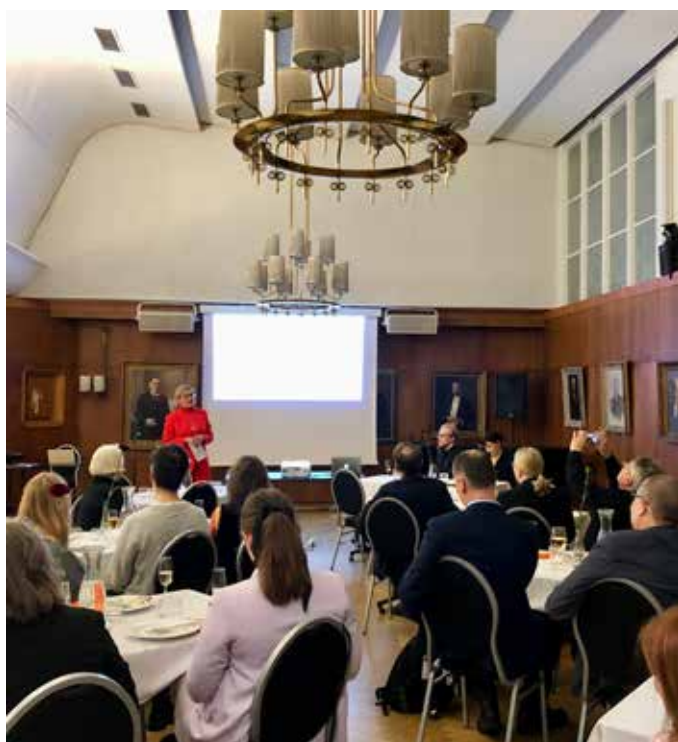
Suomen musiikkineuvoston eduskuntavaalivaikuttamistilaisuus 19.1.2023.